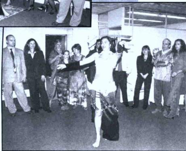
Não faltou a apresentação da empolgante dança do ventre. Um sucesso!